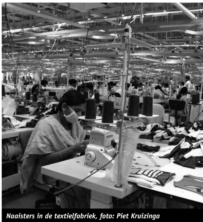
Naaisters in de textielfabriek