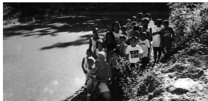
De vrouwengroep met hun kinderen naast de zelf uitgegraven visvijver.